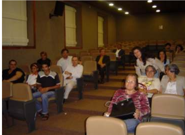
Auditório da Ds Recife

qualidade do filme garantiram a animação dos convidados, que logo após a exibição se reuniram para