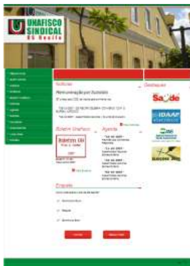
Fac-símile da página inicial do site da DS Recife

Desenvolvido pela Qualitare Comunicação, o site segue os padrões gráficos do logotipo da Unafisco Sindical, sem perder a identidade local reforçada através de imagens da sede da DS Recife e fotos dos