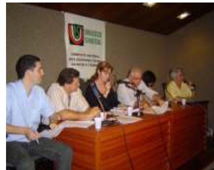
Mesa diretora Conjunta Unafisco Sindafisp-PE na sede da DS Recife

participantes foi de 92 AFRFB, sendo 64 filiados ao Unafisco (59 ativos e 5 aposentados) e 28 filiados ao Sindafisp-PE (26 ativos e 2 aposentados). As votações, no entanto, por razões estatutárias, foram realizadas em separado. A expectativa dos dirigentes da DS Recife e do Sindafisp-PE é que a experiência pioneira de Recife seja estendida a outras localidades. ■